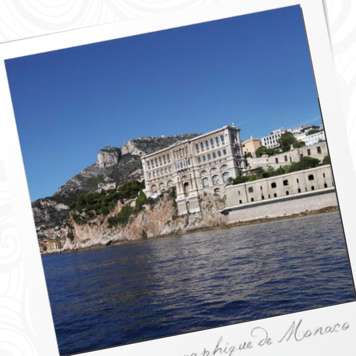
Musée océanographique de Monaco